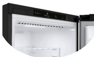
Display intérieur discret