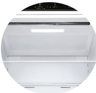
Door Cooling™ & Soft LED